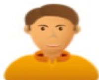
Asociaciones de Productores