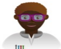
Centros de Investigación