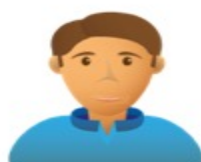
Gremios y Empresas