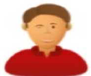
Umata y AT